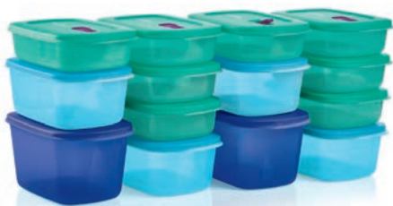
Ultime ensemble planirestes 14 pcs Cristal-Ondes® PLUS p. 5 du catalogue Automne et Fêtes

Avec de telles récompenses fantastiques, le Mois Record représente une période imbattable pour être l'hôte/sse d'une présentation Tupperware. Voyez les exclusivités pour hôtes disponibles dans cette brochure et dans le catalogue Automne et Fêtes!